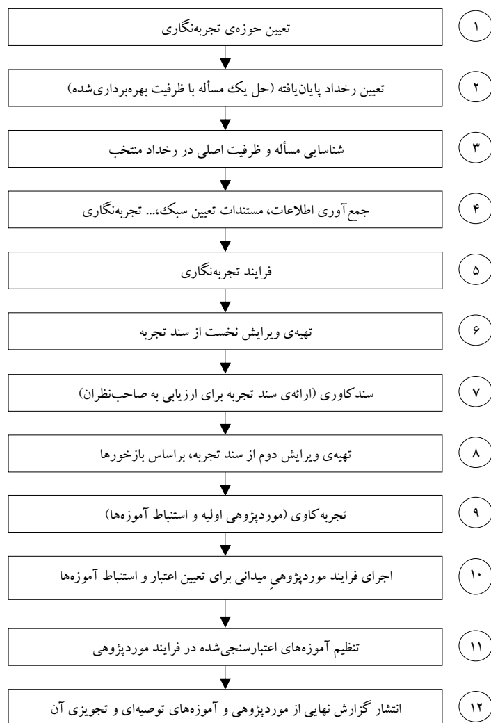
شکل ۳. فرایند موردپژوهی پیمایشی

آموزه‌ها، می‌توانند به شکل‌های گوناگون منتشر شوند و در اختیار همگان قرار گیرند و به‌عنوان گزاره‌های ابطال‌پذیر تا زمانی که به‌طور کلی از اعتبار نیفتاده‌اند مورد بهره‌برداری و کاربری واقع شوند. این فرایند در شکل (۳) نشان داده شده است: