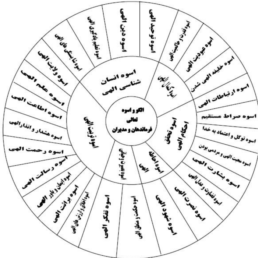
نمودار ۳. پایه‌های الگوی تعالی فرماندهان و مدیران از منظر قرآن کریم