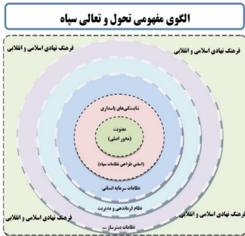
شکل ۱. الگوی مفهومی تحول و تعالی سپاه

به تعبیری می‌توان گفت شایسته‌سالاری مبتنی بر معنویت، زیربنای نظامات خواهد بود. این شایستگی‌ها و مدیریت بر آن نیز مبنایی برای ایجاد نظامات سرمایه انسانی است که در حلقه سوم مشاهده می‌شود. درحقیقت، سپاه در این الگو، به پاسداران و سایر انسان‌های مؤمن و شایسته خود به دید سرمایه و حتی اصلی‌ترین سرمایه می‌نگرد. حلقه چهارم، نظام فرماندهی و مدیریت است که در راستای انجام مأموریت‌ها، تأثیرات متقابلی بر سرمایه انسانی و سایر نظامات می‌گذارد. حلقه پنجم، سایر نظامات بستر ساز است که در حوزه‌های گوناگون تنظیم می‌شوند. این حلقه‌ها به هم