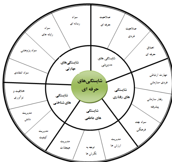
شکل ۱. شبکه مضامین شایسته‌سالاری حرفه‌ای مدیران

جدول شماره چهار در بردارنده ۱۰۹ مضمون پایه است که از بررسی مصاحبه‌ها به دست آمده است. سپس مضامین با توجه به معانی و مفاهیم مشترک میان آن‌ها در قالب ۱۶ مضمون اصلی یا فراگیر، طبقه‌بندی شدند که این مضامین شامل صلاحیت‌های حرفه‌ای، صلاحیت‌های فردی، اخلاق حرفه‌ای، مهارت‌های ارتباطات فردی، میان‌فردی و سازمانی، رفتار سازمانی پیش‌رفته، سواد چندفرهنگی، سواد رسانه‌ای، سواد رایانه‌ای، سواد پژوهشی، سواد انتقادی، خلاقیت و نوآوری، مدیریت کیفیت، مدیریت دانش، مدیریت هیجانات، توجه به نگرش‌ها و مدیریت ارزش‌ها است. در نهایت مضامین فراگیر نیز با توجه به اشتراکات معنایی و مفهومی خود، تحت عنوان ۵ مضمون سازمان‌دهنده طبقه‌بندی شدند که این مضامین نیز عبارتند از شایستگی‌های مدیریتی، رفتاری، مهارتی، شناختی و عاطفی. در ادامه با استفاده از مضامین پایه (۱۰۹)، فراگیر (۱۶) و سازمان‌دهنده (۵) به دست آمده از مصاحبه‌ها و منابع مکتوب، شبکه مضامین مربوط به الگوی شایسته‌سالاری حرفه‌ای مدیران متوسطه آموزش و پرورش استان بوشهر، براساس آموزه‌های ایرانی و اسلامی ترسیم شد.