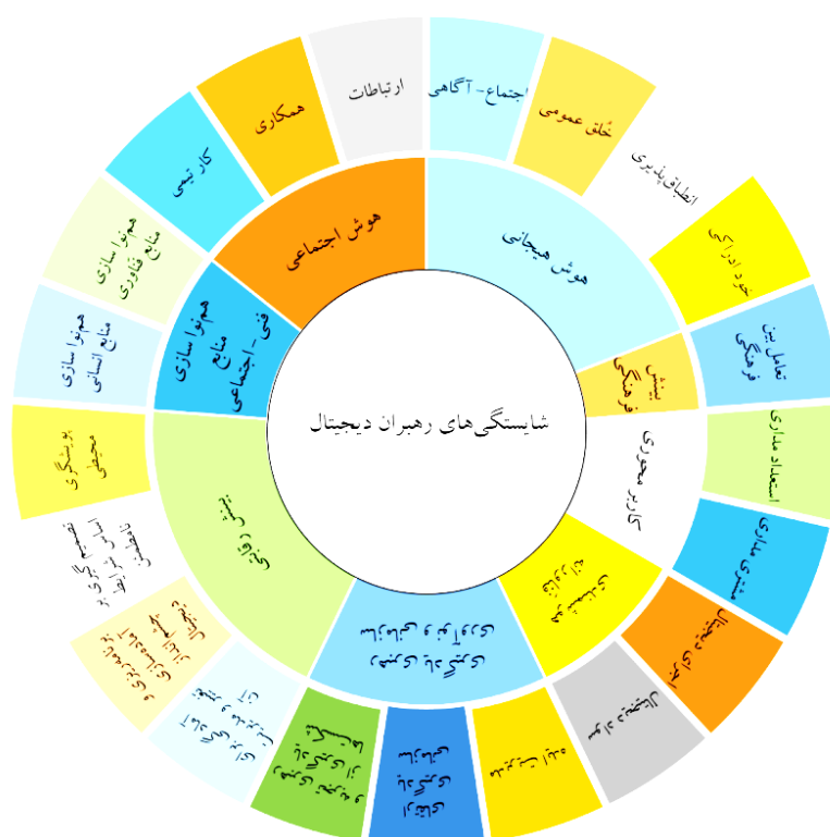
شکل ۲. چارچوب شایستگی‌های رهبران دیجیتال

از نظر اجتماعی هوشمندانه رفتار کنند (آئوینن ۱ و همکاران، ۲۰۱۹). در پژوهش پیش رو این شایستگی براساس سه مقوله «ارتباطات، همکاری و کار تیمی» شناسایی می‌شود. شایان ذکر است هوش اجتماعی می‌تواند جهت‌گیری مثبت یا منفی داشته باشد. به اعتقاد هرنز- بروم ۲ (۲۰۱۲) هوش اجتماعی را می‌توان با تقویت هوش هیجانی در جهت مثبت هدایت و تقویت کرد. بر این اساس است که روابط اجتماعی درست و مبتنی بر اصول اخلاقی شکل خواهد گرفت و همکاری و روابط تیمی بر مدار اعتماد، صداقت و راستی برقرار خواهد شد.