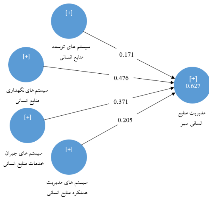
نمودار ۱. مدل معادلات ساختاری در حالت تخمین استاندارد ضرایب مسیر

در ادامه نمودار مسیر مدل برازش شده همراه با پارامترهای برآورد شده (مقادیر استاندارد) ارائه شده است.