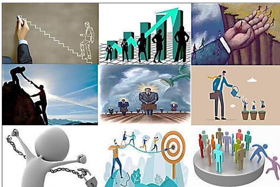
شکل ۱. تصاویر ارائه شده به وسیله برخی از مشارکت کنندگان