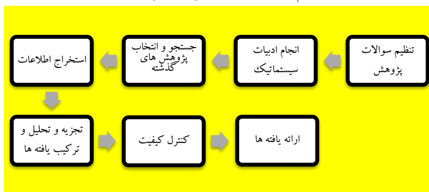
شکل ۱. فرایند انجام فراترکیب (سندلوسکی و باروسو، ۲۰۰۷)

این پژوهش از نظر هدف جزء پژوهش‌های کاربردی و از نوع پژوهش‌های کیفی است. در این پژوهش از روش فراترکیب که یکی از روش‌های فرامطالعه است؛ استفاده شده است. فرامطالعه یکی از روش‌هایی است که به منظور بررسی، ترکیب و آسیب‌شناسی مطالعات پیشین به کار می‌رود. فرامطالعه در برگیرنده مجموعه فراتحلیل، (تحلیل کمی یافته‌های پژوهش‌های گذشته) فراترکیب (تحلیل کیفی یافته‌های پژوهش‌های گذشته)، فرا روش (تحلیل روش‌شناسی پژوهش‌های گذشته) و فرا نظریه (تحلیل نظریه‌های پژوهش‌های گذشته). فراترکیب نوعی روش پژوهشی است که خود به ارزشیابی پژوهش‌های دیگر می‌پردازد؛ بنابراین فراترکیب نوعی روش پژوهشی درباره پژوهش‌های دیگر است. در این پژوهش از روش هفت مرحله‌ای سندلوسکی و باروسو (۲۰۰۷) استفاده کرده‌ایم که خلاصه این مراحل در شکل شماره ۱ نشان داده شده است.