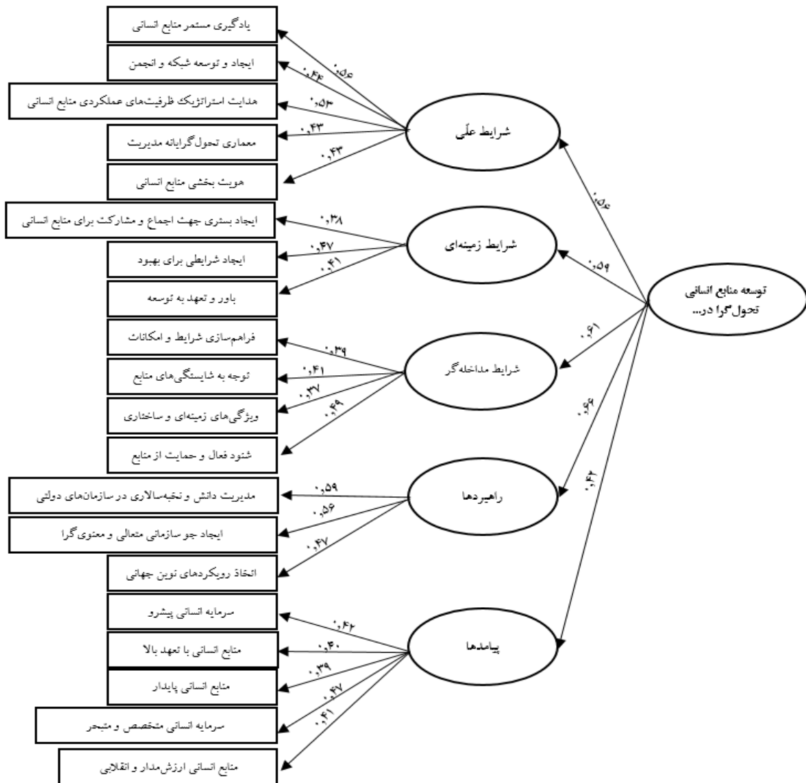
دیاگرام ۱. مدل تحلیل مسیر شاخص‌های الگو